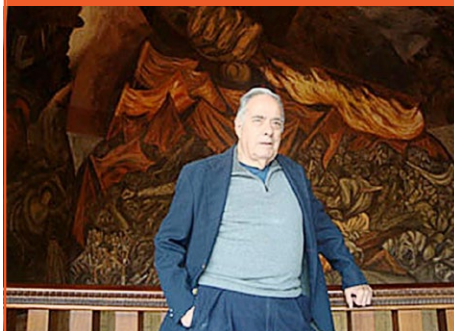
José Clemente Orozco (1883 - 1949) Muralista

El más viejo de los famosos muralistas mexicanos. Sus murales son de tema social y político, cuyo fin es educar al pueblo a desarrollar una conciencia nacional.