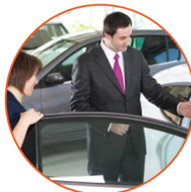
vender to sell