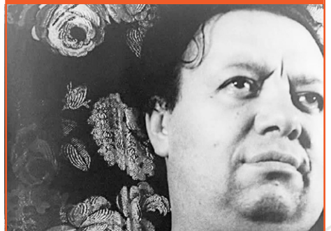
Diego Rivera (1886 - 1957) Artista

El muralista mexicano más conocido. En los años 20 realizó numerosos murales por encargo del gobierno mexicano.