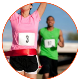
ganar (un partido) to win