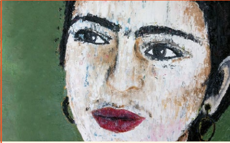
Frida Kahlo (1907 - 1954) Artista

Su vida y su obra fueron marcadas por el dolor, reflejado en sus numerosos autorretratos. Su obra es hoy reconocida mundialmente, gracias en parte a la película Frida .