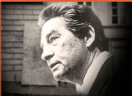
Octavio Paz (1914 - 1998) Poeta

Poeta, ensayista, traductor, editor y gran promotor de las letras mexicanas. Fue el primer mexicano que ganó el premio Nobel de Literatura (1990).