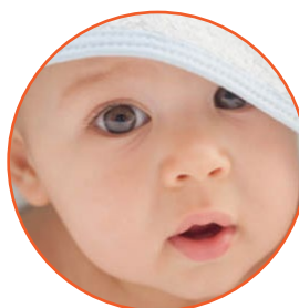
el bebé baby