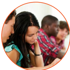
enseñar to teach