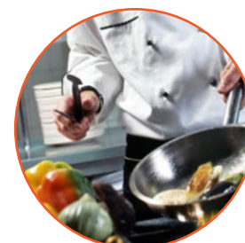
preparar to prepare