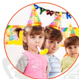
la fiesta party