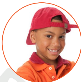
el niño, chico boy