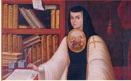
Sor Juana Inés de la Cruz (1648 - 1695) Poeta

Llamada la "Décima Musa de México" y por el carácter de su obra se le reconoce como la "pionera" del movimiento moderno de liberación.