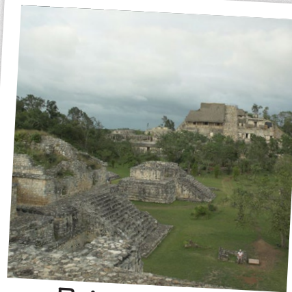
Ruinas Mayas y Aztecas