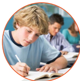
la clase class